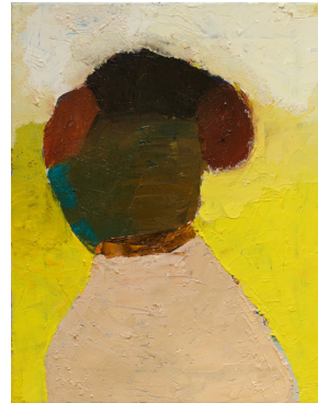
Nr. 6 Die neuste Arbeit! Entstanden im April 2018