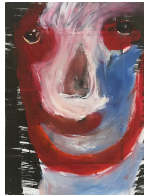
Nr. 20 Die älteste Arbeit! Entstanden 2004

Herzlichen Dank für Eure Teilnahme am Wettbewerb ÜBER DEN FORTSCHRITT!